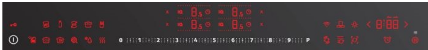
uživatelské rozhraní DSI

Do tohoto menu můžete vstoupit, když přístroj připojíte k elektrické síti po 15 vteřinách a až do 2 minut.